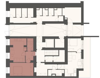
Schéma půdorysu představuje dispoziční řešení. Vybavení kuchyňskou linkou, vestavěnými skříněmi, nábytkem apod. není předmětem prodeje. Plochy jednotlivých místností jsou orientační. Developer si vyhrazuje právo na změnu.

* Podlahová plocha je vypočtena podle nařízení vlády č. 366/2013 Sb. jako půdorysná plocha ohraničená vnitřními stranami obvodových zdí bytu včetně půdorysné plochy všech svislých nosných i nenosných konstrukcí uvnitř bytu. Nezahrnuje balkony, lodžie, terasy, předzahrádky a jiné zpevněné plochy.