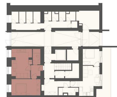
Schéma půdorysu představuje dispoziční řešení. Vybavení kuchyňskou linkou, vestavěnými skříněmi, nábytkem apod. není předmětem prodeje. Plochy jednotlivých místností jsou orientační. Developer si vyhrazuje právo na změnu.

* Podlahová plocha je vypočtena podle nařízení vlády č. 366/2013 Sb. jako půdorysná plocha ohraničená vnitřními stranami obvodových zdí bytu včetně půdorysné plochy všech svislých nosných i nenosných konstrukcí uvnitř bytu. Nezahrnuje balkony, lodžie, terasy, předzahrádky a jiné zpevněné plochy.